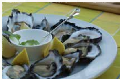
生蚝庄, 巴特曼斯海湾