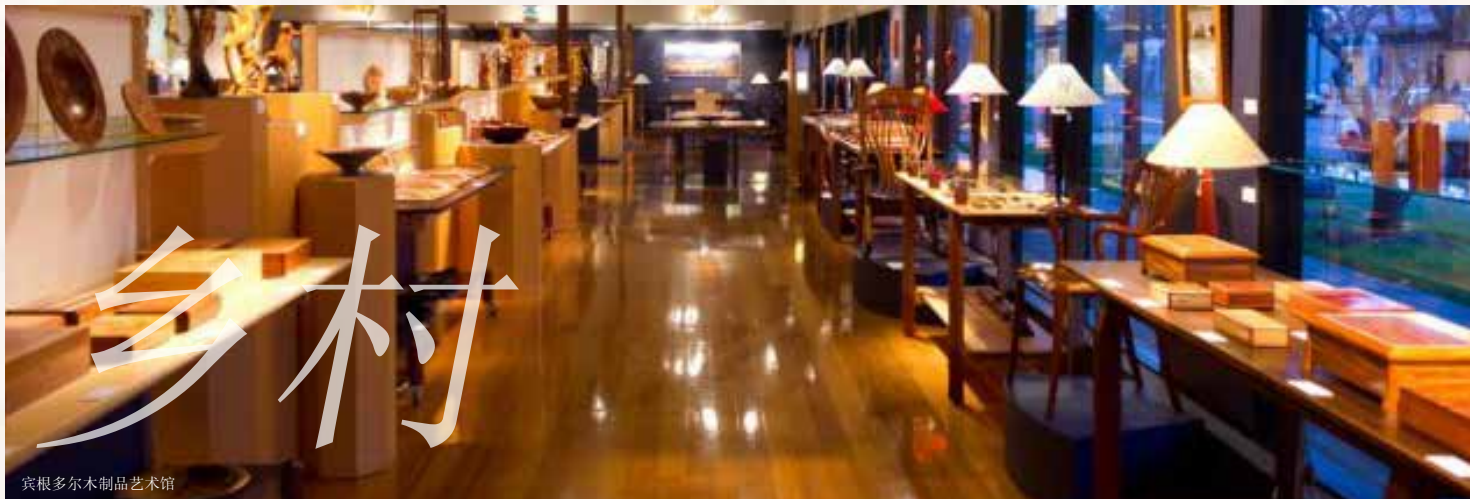
宾根多尔木制品艺术馆