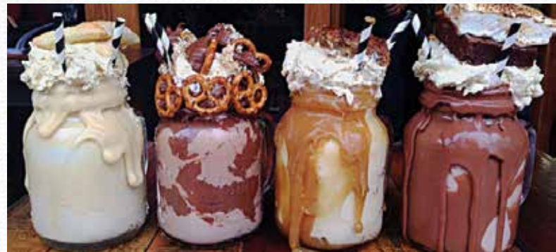
Pâtisserie, City Centre