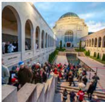
Australian War Memorial 澳大利亚战争纪念馆