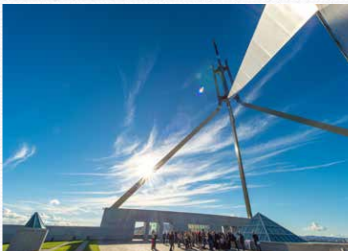
Parliament House 国会大厦