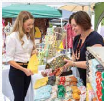
Old Bus Depot Markets 旧车厂集市