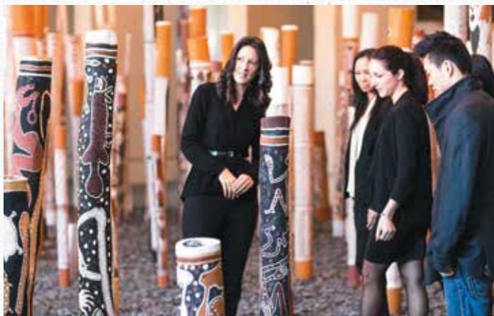
National Gallery of Australia 澳大利亚国家美术馆