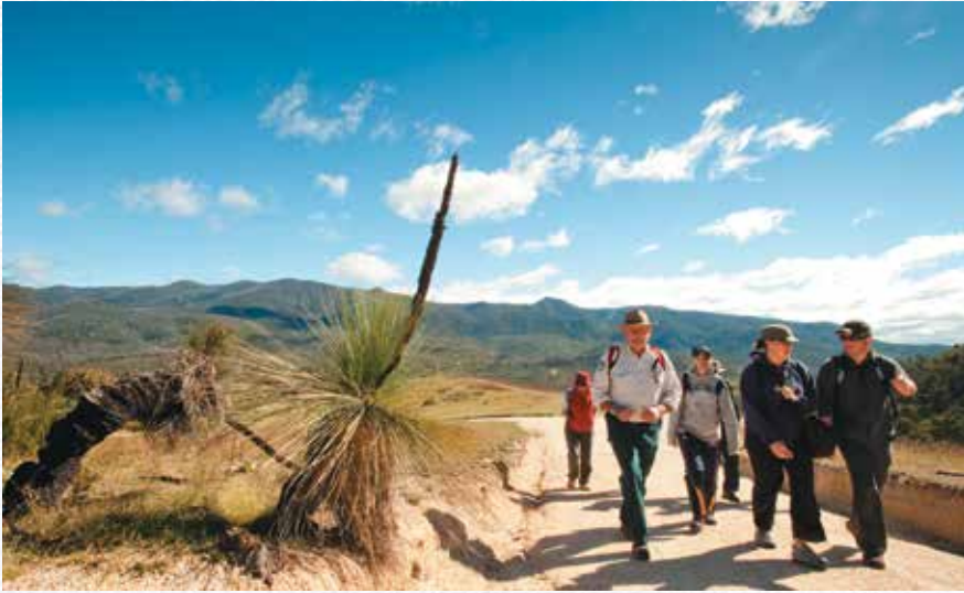
Tidbinbilla Nature Reserve 汀宾贝拉自然保护区